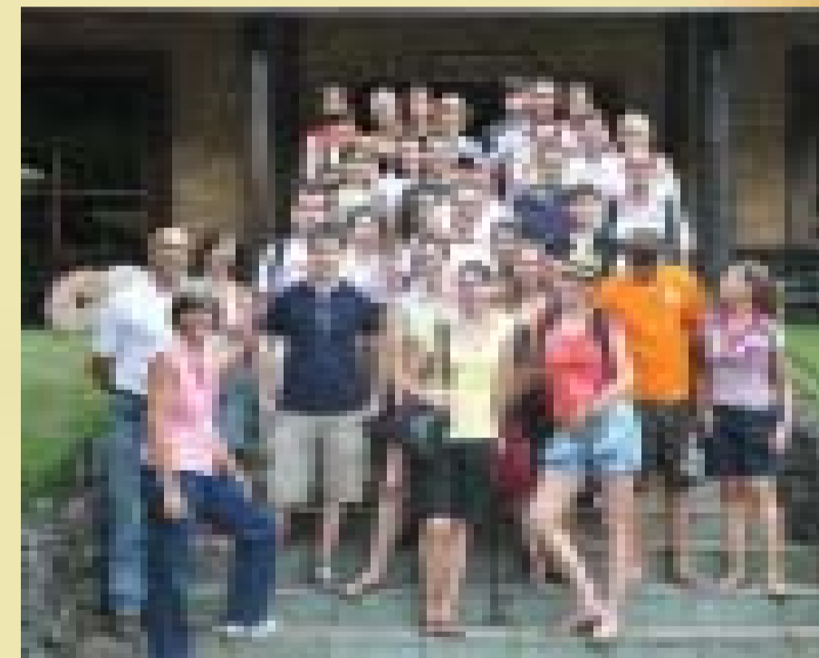
Grupo de alemães foram recepcionados pelos empresários da Top Coffee em Pinda