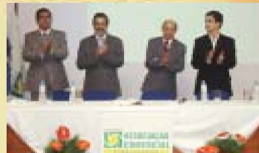
Nova diretoria da ACE Caragua toma posse com a presença de lideranças classistas e políticos