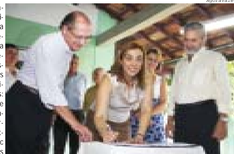
Moreira César terá curso técnico de logística no 2º Semestre de 2010

Os moradores do distrito de Moreira César poderão contar, a partir do segundo semestre, com dois cursos técnicos gratuitos: de logística e de administração. Os cursos, uma extensão da Etec João Gomes de Araújo, serão ministrados na Escola Estadual Prof. Rubens Zamith.