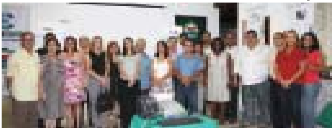
Contabilistas participantes do Grupo Empreender de Pinda (Geconp) durante ato de lançamento da cartilha