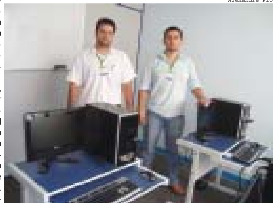
Moderno laboratório de informática traz ensino de qualidade