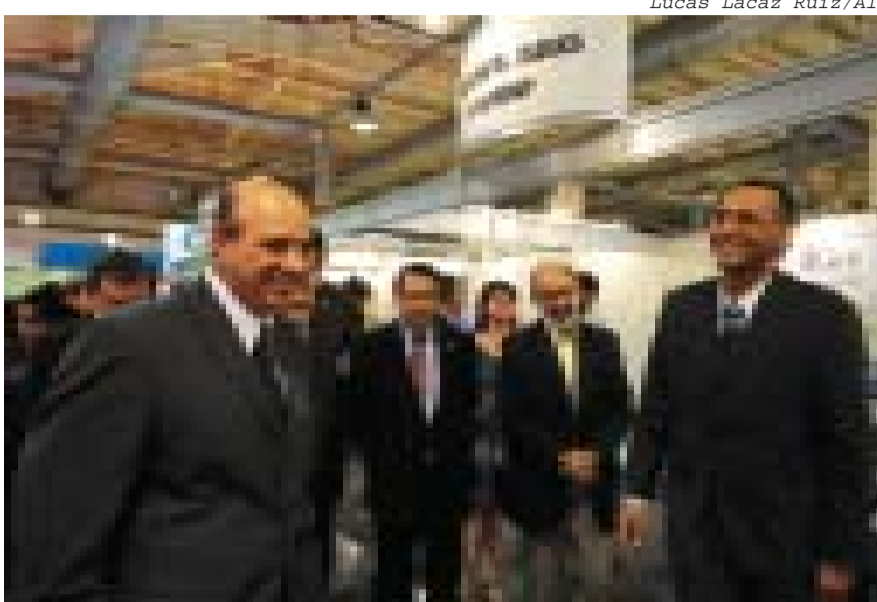
Autoridades prestigiaram o evento em São José dos Campos

Durante o evento, aconteceu uma programação paralela, como o seminário "Oportunidades de Negócios no Fornecimento do Setor de Petróleo e Gás Natural", promovido pela Secretaria de Estado do Desenvolvimento. Outro evento foi realizado pelo sistema Ciesp/Fiesp que promoveu uma rodada de negócios com a participação confirmada de empresas como: Delphi, Eaton, Kodak, Erickson, Embraer, General Motors, Johnson & Johnson, Eaton, Nestlé, Panasonic, Petrobras, Radici, Viapol e TI Automotive.