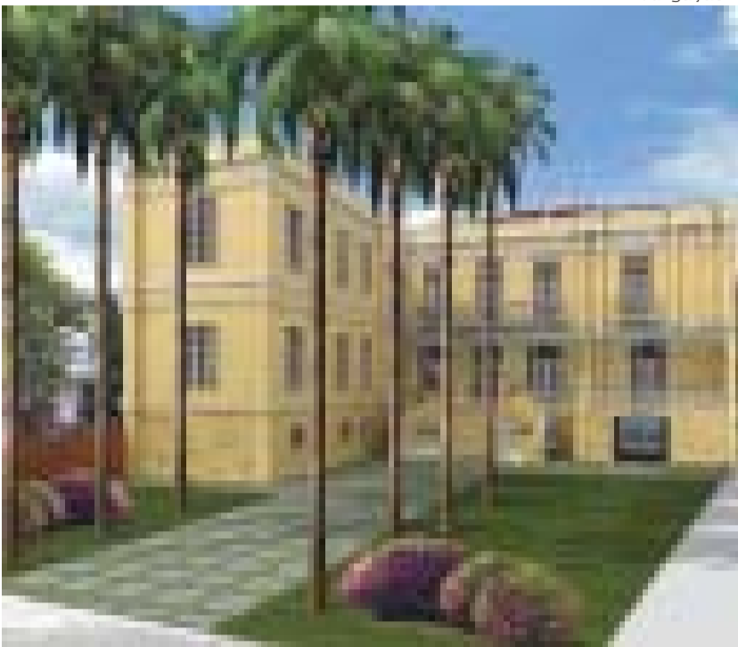
Imagem mostra a perspectiva de como ficará a restauração