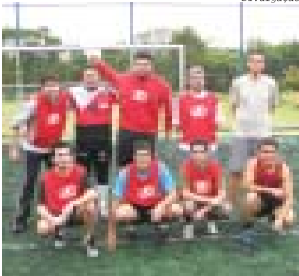
Equipe Vermelha sagrou-se campeã no Torneio realizado pela Embras

Foi realizado recentemente pela empresa Embras.Net, no Haruo Sports, o 1º Campeonato de Futebol Society.