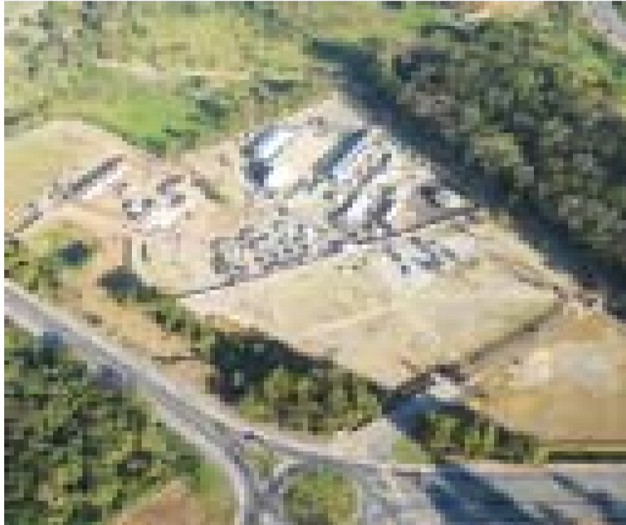
Visão aérea do espaço, junto ao anel viário, onde a feira é realizada com sucesso

Os 10 shows terão entrada simbólica, ou seja, um quilo de alimento não perecível, e todo o material arrecadado durante o evento será destinado a entidades assistenciais atendidas pelo Fundo Social de Solidariedade de Pindamonhangaba (FSS).