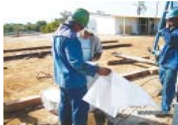
Canteiro de obra do hospital gera empregos na construção civil

realizando serviços e atendimentos aos clientes de Pindamonhangaba e do Distrito de Moreira César, além das cidades de Lagoinha e Roseira.