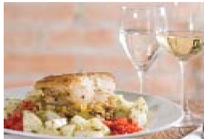
Imagens mostram o profissionalismo de Robson Salgado na produção de fotografias para publicidade

O Estúdio Vitrine localiza-se na Praça do Fórum, 35 – Centro, Pindamonhangaba (SP). Telefone para contato: (12)3645-7825.