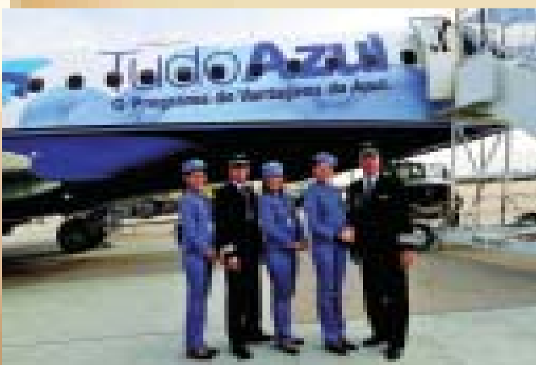
Funcionários da Linhas Aéreas Azul, caçula da aviação, e cliente da Embraer, durante visita do presidente da empresa em São José