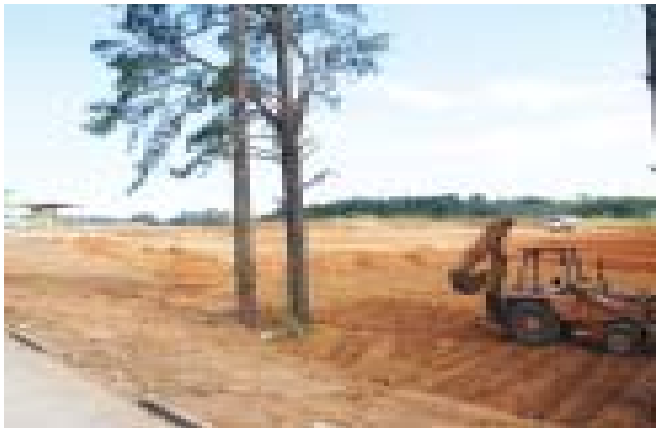
Máquinas nivelam terreno onde será construído o shopping, ao lado da empresa Dongwoo