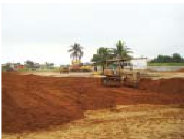
Serviços de terraplanagem dão início às obras de construção do Hospital Unimed Pinda

Atualmente, a cooperativa conta com mais de 120 médicos cooperados, 180 colaboradores e atende mais de 40 mil pessoas, representando cerca de 30% da população do município. A entidade tem uma história de 33 anos,