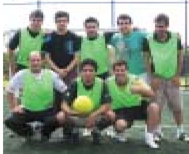
Equipe Verde foi a segunda colocada

A Embras.Net, tendo em vista o grande sucesso da primeira edição, pretende realizar outros eventos semelhantes, com a introdução de novas modalidades esportivas, sempre com a finalidade de proporcionar diversão, interação e a prática do esporte aos seus funcionários.