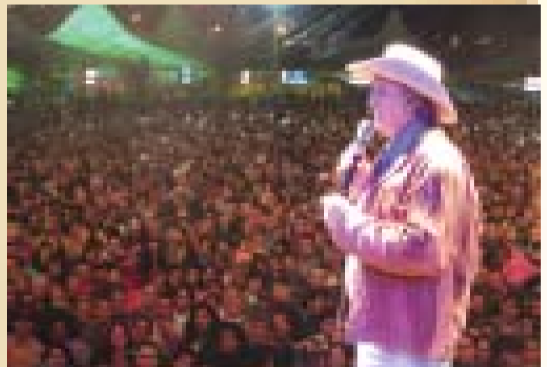
O cantor Sérgio Reis foi uma das atrações que levou milhares de fãs a Festa de São João, em Caçapava.