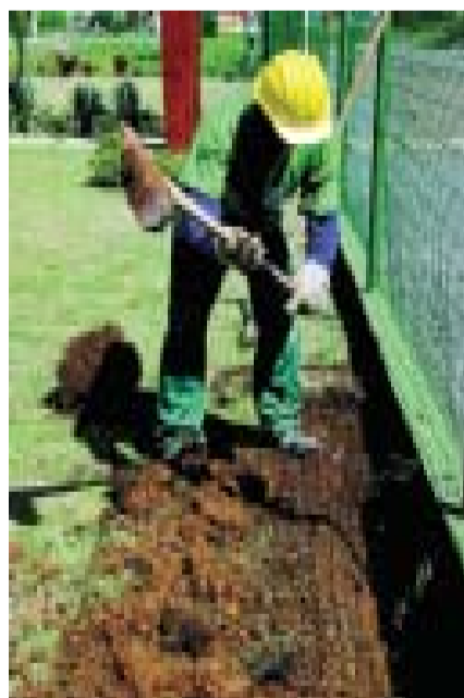
Obras foram iniciadas no primeiro condomínio ecológico de Taubaté Vie Nouvelle