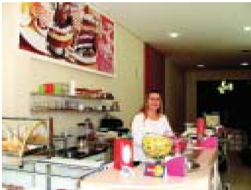
Proprietária da empresa com o novo endereço

Procurando proporcionar melhor atendimento e maior bem estar aos seus clientes, a Confeitaria Sandra Roza, de Pindamonhangaba, está de mudança para a rua Coronel Fernando Prestes, número 73.