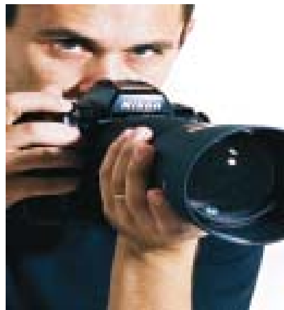
Fotógrafo Robson Salgado

Se a propaganda é a alma do negócio, a imagem é a essência da alma. Muitas propagandas, filmes publicitários ou até mesmo um álbum de casamento ganham destaque pela qualidade profissional da imagem e da fotografia. Com essa visão, o Estúdio Vitrine vem ganhando destaque pelo trabalho do fotógrafo Robson Salgado.