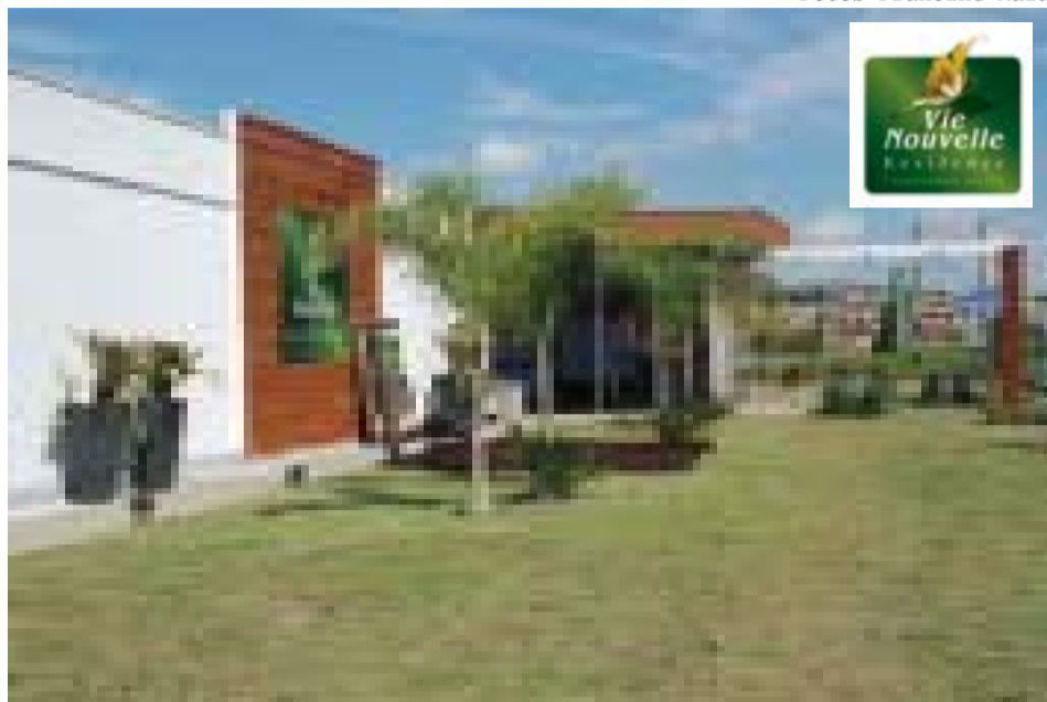
Fachada do Vie Nouvelle - o primeiro condomínio ecológico de Taubaté

Credenciada com a experiência de quase três décadas atuando no mercado da construção civil no Vale do Paraíba e Litoral Norte, a empresa Ladeira Miranda Engenharia e Construção é um exemplo de administração e profissionalismo.