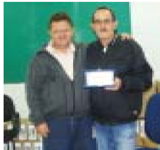
Diretor da empresa (esquerda), entrega cartão de prata