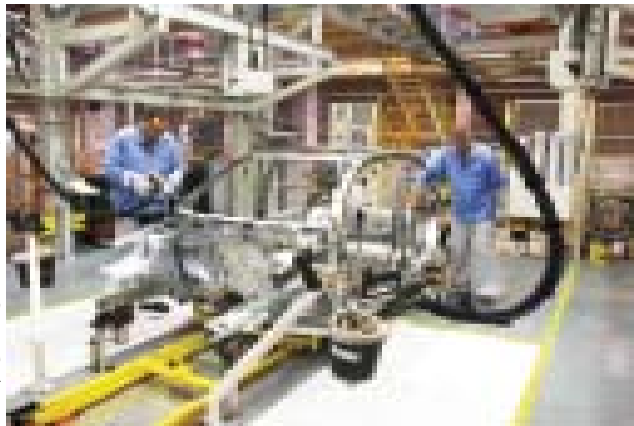
Funcionários da empresa trabalham na armação da carroceria