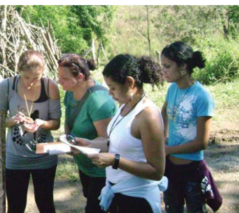
Persistência e determinação são elementos desenvolvidos nos treinamentos realizados pela Simbiose

Segurança Privada: especialistas indicam investimento em prevenção