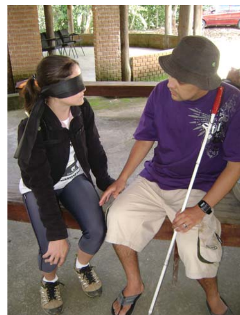
Atividades estimulam a confiança no próximo

Outras informações pelo site www.simbioseaventura.com.br ou pelo telefone 9108-5777.