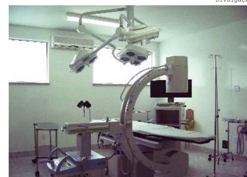
Acima as condições internas da sala de cirurgia após a interferência administrativa dos executivos de Lorena