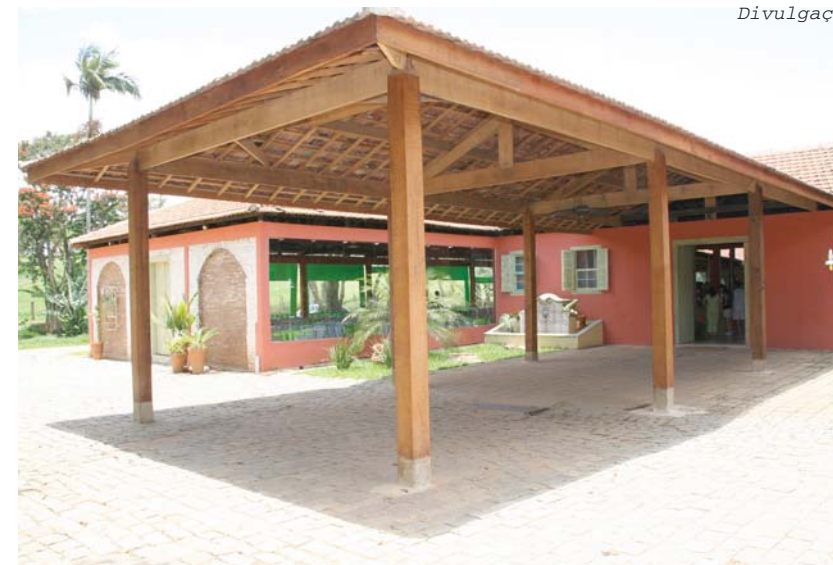
Desativada há 15 anos, a fazenda está totalmente recuperada