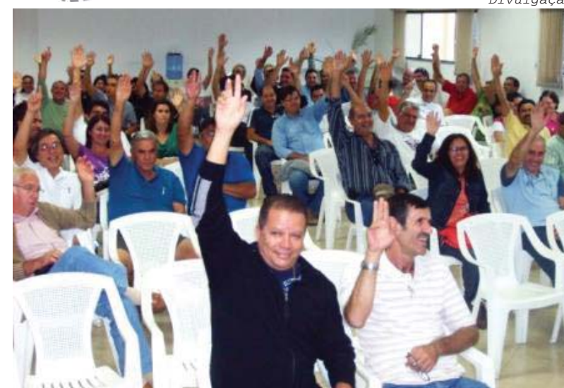
Associados optam pela compra do clube, em unanimidade

Em Assembléia Geral Extraordinária, realizada recentemente pela Associação Comercial de Ubatuba, os associados decidiram sobre a área social do Taquaral, denominada Clube ACIU. O evento contou com a participação de 93 associados representados e decidiu, por unanimidade, pela compra do imóvel pelo valor de R$ 530 mil.