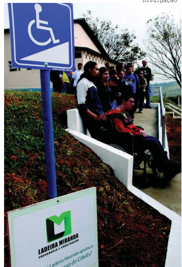
Construída pela Ladeira Miranda Engenharia, rampa no Ciavex é inaugurada

O Centro de Instrução de Aviação do Exército (CIAvEx), em parceria com a Ladeira Miranda Engenharia e Construção, entregou recentemente a obra da rampa de acesso para portadores de necessidades especiais em sua