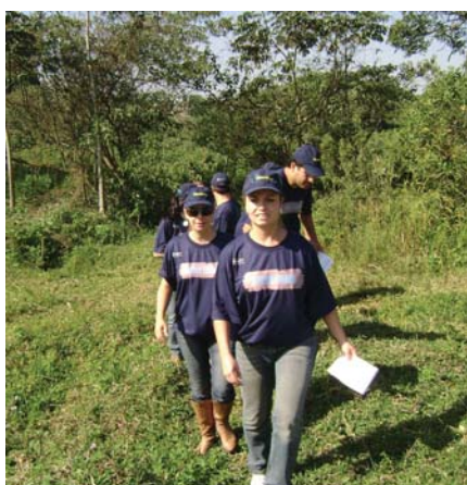
Controle do Tempo é um dos temas desenvolvidos no treinamento ao ar livre