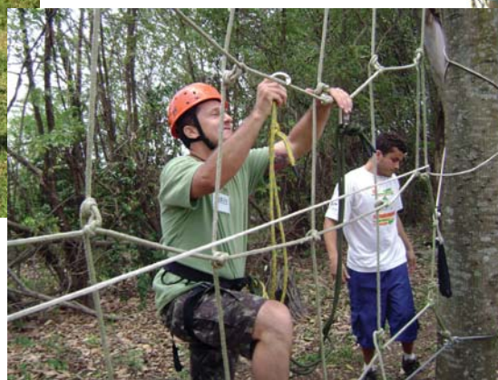
Colaboradores das empresas recebem desafios sobre liderança e humildade