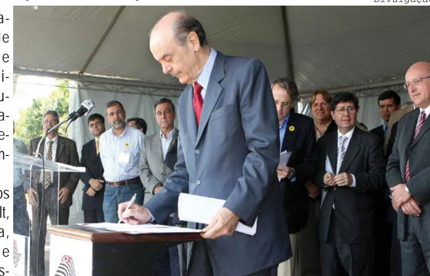
Atitude dos empresários chamou a atenção do governador José Serra, que foi conferir pessoalmente o exemplo de associativismo

“Para se ter uma idéia os quartos dos pacientes têm no máximo dois leitos, além de banheiro privativo com boxes de vidro e chuveiro aquecido a gás. Realizamos um trabalho de saneamento, enxugamos o quadro administrativo, vendemos a folha de pagamento em troca