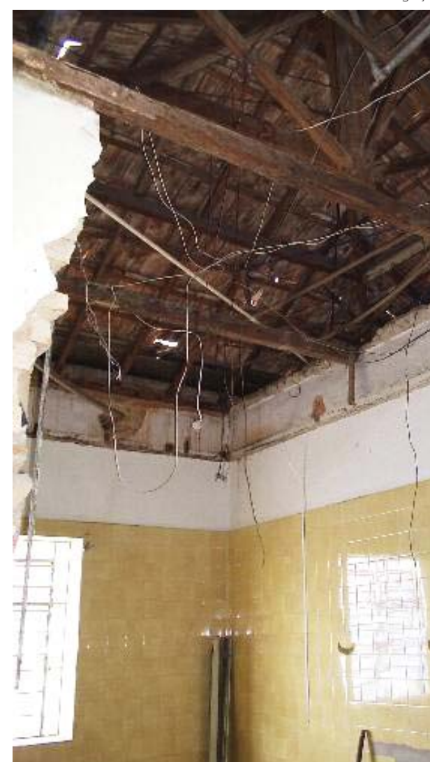
Sem manutenção prédio funcionava precariamente

Segundo ele, com a ação dos empresários a instituição ganhou mais credibilidade e aumentou o interesse da sociedade em participar, colaborar e até doar recursos financeiros espontâneos para a instituição de saúde. “Esse grupo não busca retorno ou lucro para suas empresas. Ajudamos com o nosso tempo, dedicação e com aquilo que cada um sabe fazer de melhor. Por isso chamamos de missão de associativismo”.