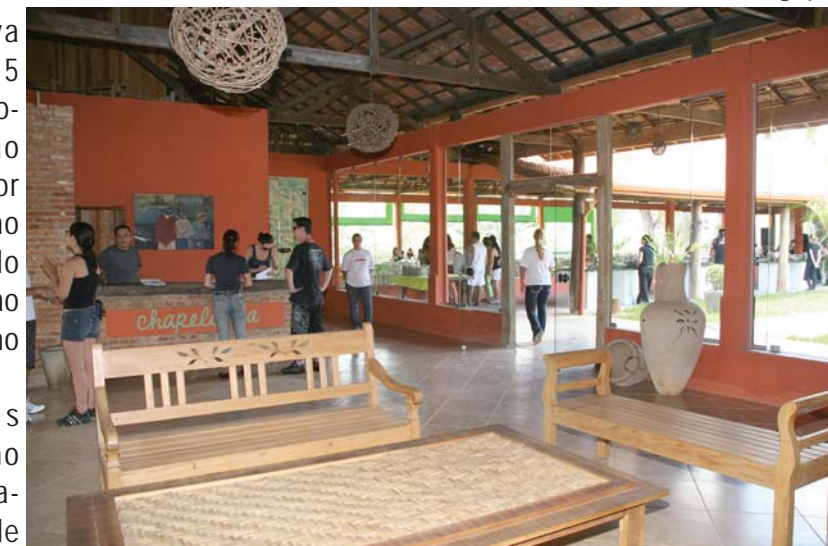
Recepção decorada mostra o ambiente acolhedor para realização de eventos