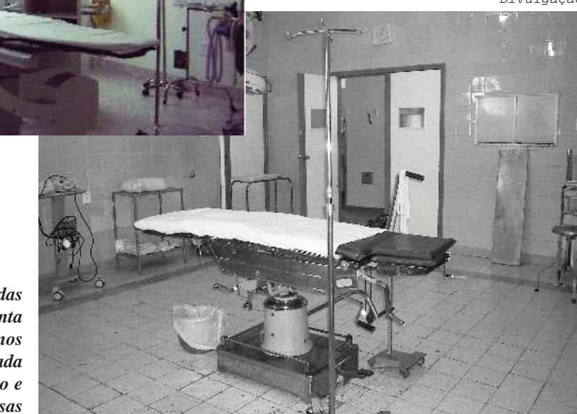
Ao lado, o registro das dependências da Santa Casa há cerca de 5 anos realidade transformada pela união da população e empresas