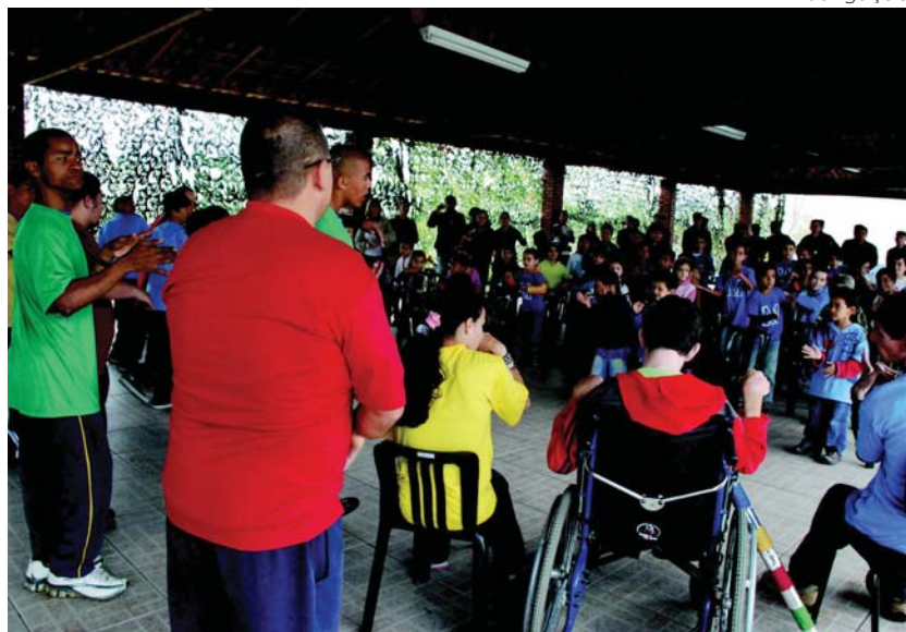
Alunos da Escola Madre Cecília fazem apresentação no CIAvEx

Com essa iniciativa, o CIAvEx e a Ladeira Miranda aderem à "Campanha da Acessibilidade - Siga essa Idéia" do Governo Federal, que visa sensibilizar e mobilizar a sociedade em relação ao respeito às diferenças e aos direitos fundamentais de todas as pessoas, proporcionando a elas o direito da plena utilização dos espaços de uso coletivo, através de melhorias dos acessos a pessoas com deficiência, seja ela física, sensorial (auditiva e vi-