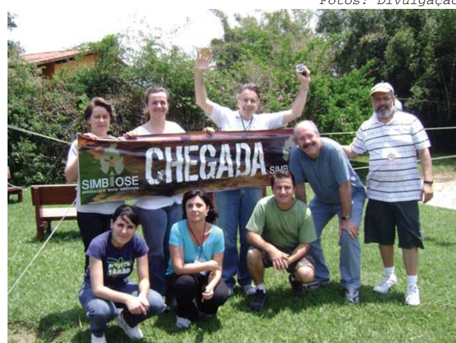
Colaboradores recebem treinamento da Simbiose

O Outdoor Training é um Treinamento Vivencial focado no desenvolvimento e fortalecimento de competências das equipes de trabalho, através