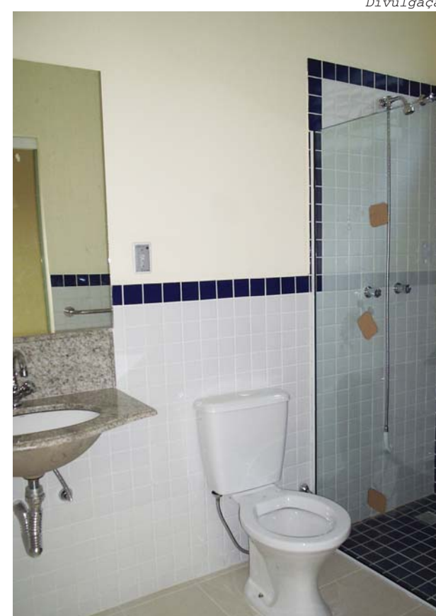
Banheiro da Santa Casa ganha aspecto moderno