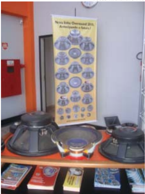
Oversound apresenta sua nova linha de produção 2010

Para melhorar a qualidade e garantia de sua produção, a Oversound está em fase final de monta-