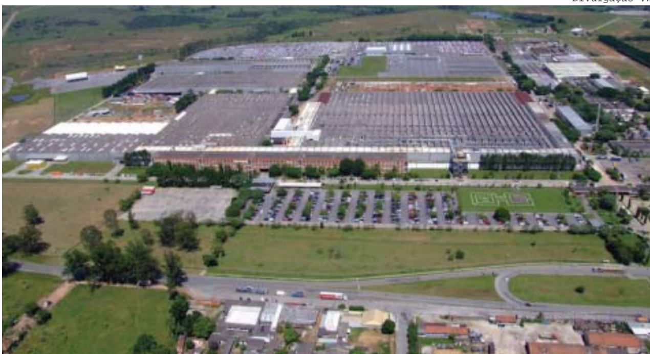
Vista aérea da unidade da Volkswagen em Taubaté, onde já foram produzidos cerca de 5 milhões de automóveis ao longo dos últimos 33 anos, quando a empresa iniciou suas atividades no município