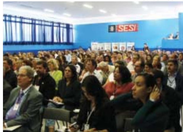
Mais de 400 pessoas participaram do evento no SESI