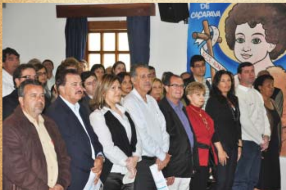
Prefeitos da região e autoridades participam do Circuito Caipira em Taubaté