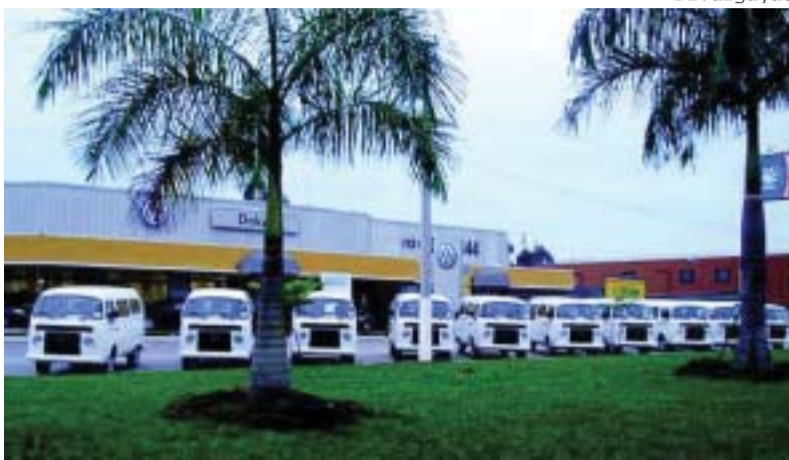
Venda para o setor corporativo aumentou na concessionária

Garantindo preço de fábrica, o programa é uma novidade do Departamento de Vendas Especiais, que atende segmentos específicos da sociedade como: governo (municipal, estadual ou federal), frotistas, taxistas, portadores de necessida-