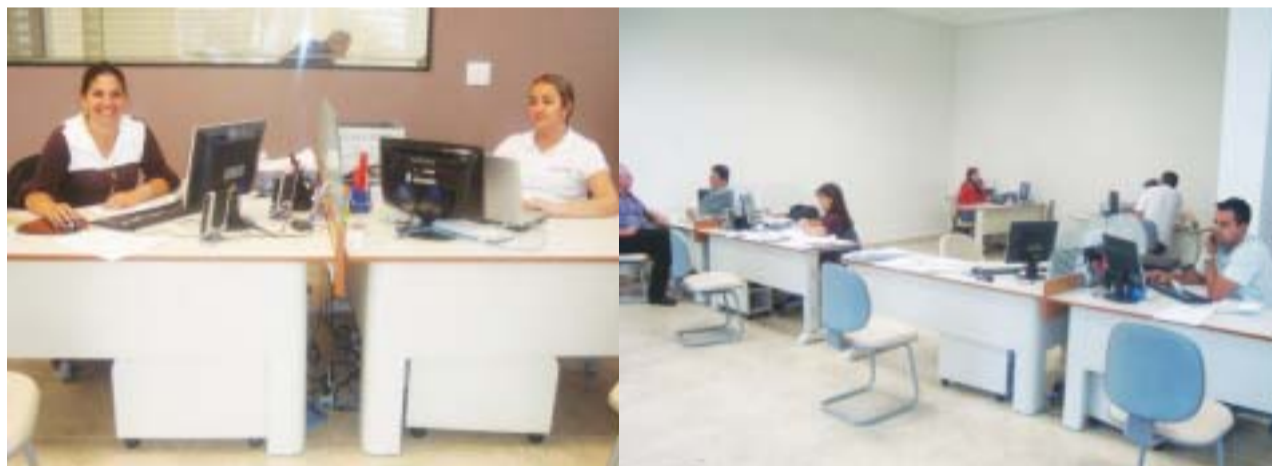
Profissionais preparados num ambiente agradável, são marcas do atendimento na empresa Vale Seguros

Outra importante questão levantada em nossa entrevista é o risco que cliente corre ao contratar serviços de profissionais não habilitados no mercado segurador. "É importante que o cliente verifique se o corretor ou a empresa está habilitado. Entre no site www.susep.gov.br e verifique informações sobre a credibilidade. Em casos de suspeita, comunique ao PROCON ou ao sindicato da categoria (SINCOR/SP), telefone 08000114999.