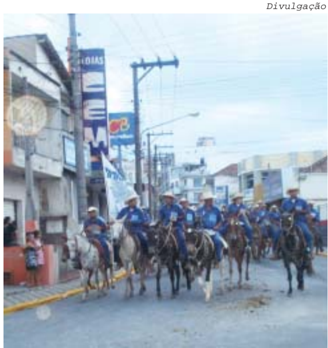
Tropeiros participam de procissão em Guaratinguetá

É importante ressaltar que no domingo, 20, os organizadores deverão realizar provas de muares e equinos no Recinto do Sindicato, com direito a premiações e troféus. Em seguida, será servido no restaurante do Sindicato o tradicional Almoço Tropeiro, com apresentação de duplas sertanejas e outras atividades focando a educação e a cultura.