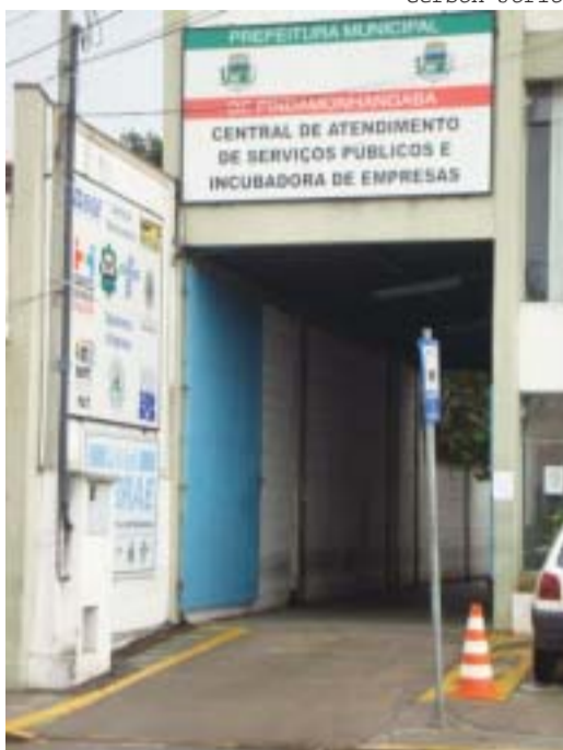
Acesso ao prédio da Incubadora, localizada na Albuquerque Lins

A área reservada para incubadora tem 545m 2 e atualmente funciona na Av. Albuquerque Lins, 138 dando suporte a 16 empresas (sendo 8 re-