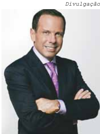
João Doria Jr

Para ajudar nos trabalhos, o LIDE contará com um Comitê de Gestão que auxiliará na discussão dos