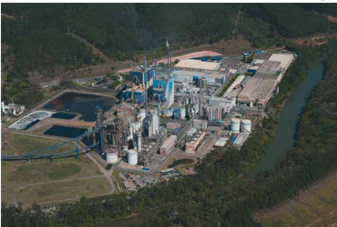
Vista aérea da fábrica Fibria

“A valorização do dólar médio e a manutenção de uma demanda favorável por celulose no mercado internacional colaboraram para que a Fibria atingisse novos patamares em seus resultados trimestrais. Prova disso são os recordes de receita líquida e Ebitda da companhia não apenas no período de três meses, mas também no acumulado de 12 meses até