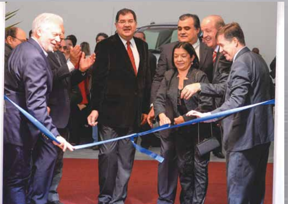
Abertura da 18ª Fessecre 2015 - Feira de Tecnologia para Indústrias