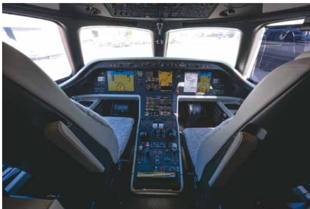
Cockpit do Legacy 450

A Embraer apresentará ao mercado brasileiro pela primeira vez o jato Legacy 450, nova aeronave executiva da empresa, durante a 12ª edição da Labace (Latin American Business Aviation & Conference), a maior feira de aviação executiva da América Latina e que acontece entre os dias 11 e 13 de agosto no Aeroporto de Congonhas.