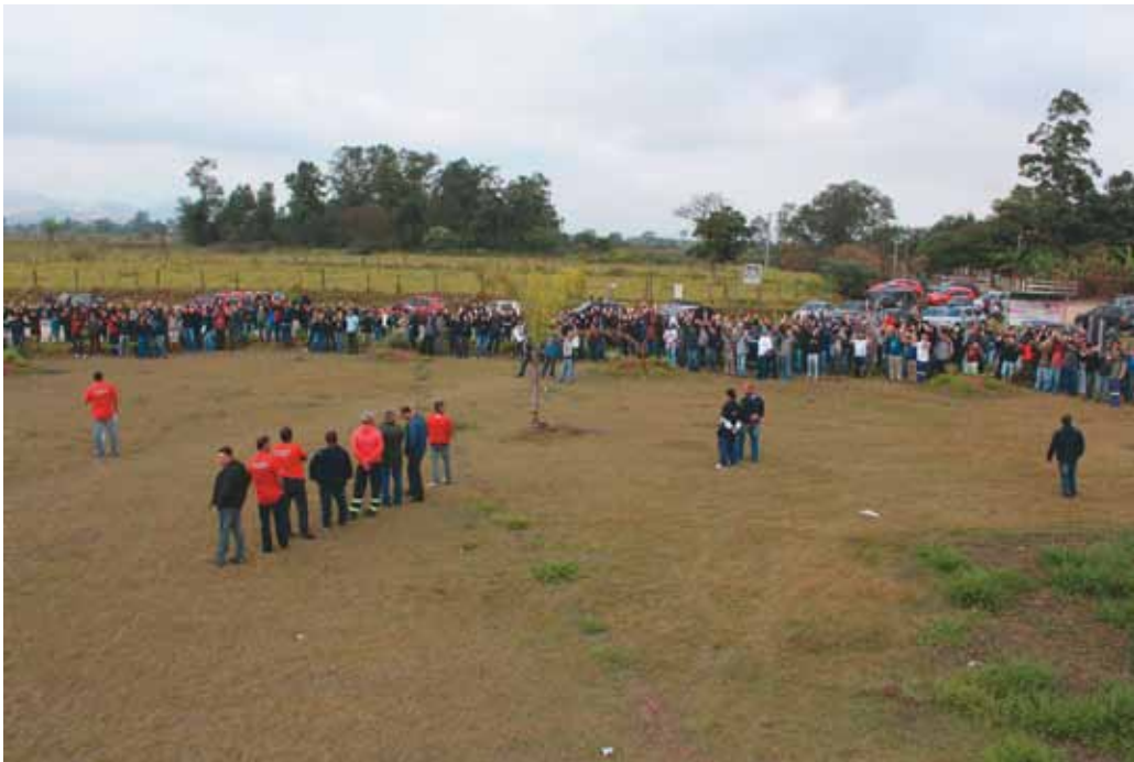
Assembléia na Gerdau de Pinda, faz novo lay-off com 200 funcionários

Os trabalhadores da Gerdau aprovaram em assembleia neste mês, uma nova etapa de lay-off (suspensão do contrato de trabalho) com 200 funcionários.